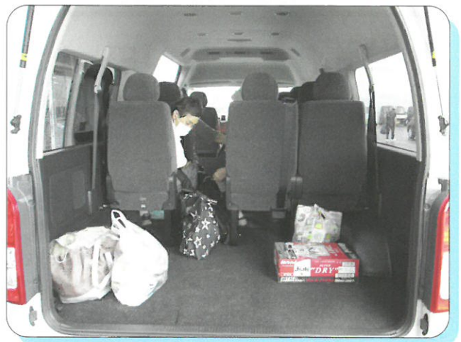
(御徳3区の皆さんの買物風景 トライアル小竹店)

高齢者等日常生活買物支援事業は、月曜日から金曜日の午前まで、ワゴン車で、各地区の集合場所に時間を決めてトライアル小竹店まで運行しています。重い荷物や日用品等の買物などを自宅まで送迎します。皆さん利用して下さい。